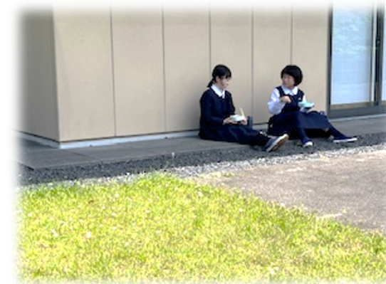
自習に来た土曜日・・・ 天気のいい日は中庭でランチ♪